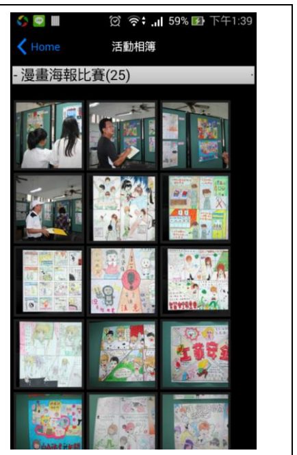
專題製作課程-實習處 app