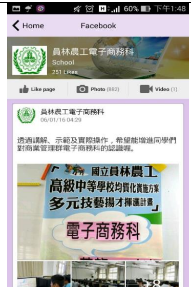
專題製作課程-電商科 app