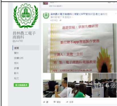
專題製作課程-FB 粉絲頁經營管理