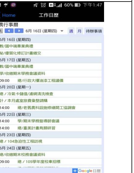
專題製作課程-電商科 app