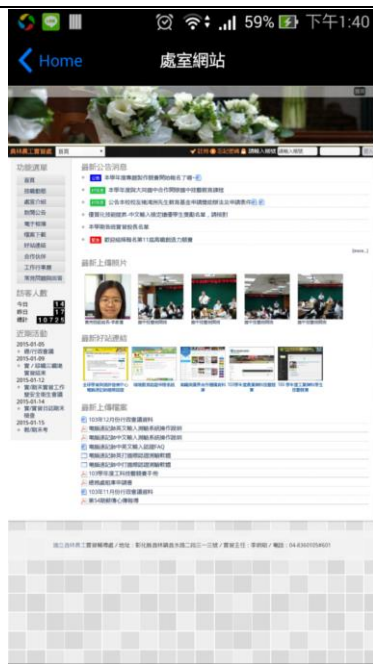
專題製作課程-實習處 app