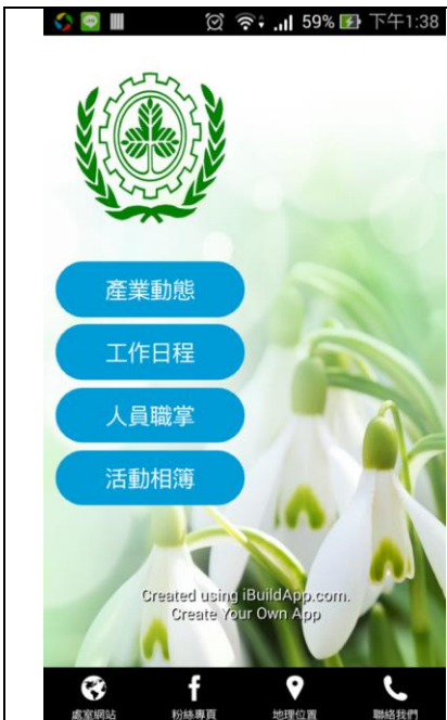
專題製作課程-實習處 app