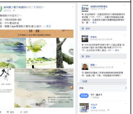
專題製作課程-FB 粉絲頁經營管理