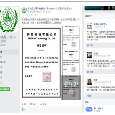
專題製作課程-FB 粉絲頁經營管理