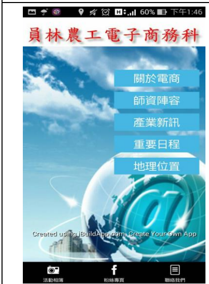
專題製作課程-電商科 app