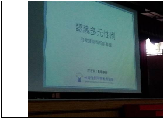
本日主題:認識多元性別