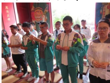
主祭同學代表入殿