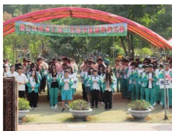
助祭同學協助點香發放