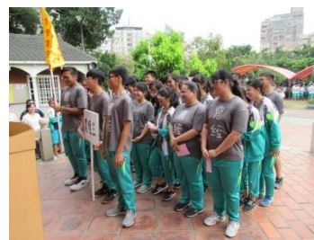
全班於殿前大聲齊呼口號