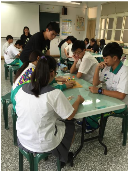
內容 3：桌遊體驗活動