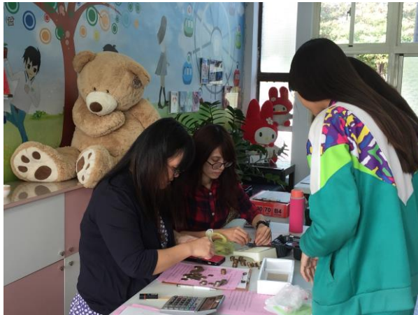
內容 4：慈善會班級募款活動