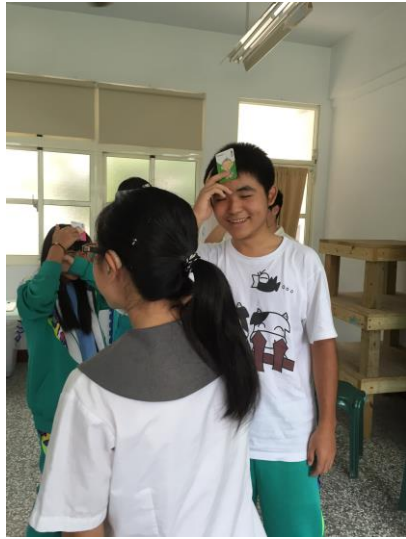
內容 3：情緒辨識活動