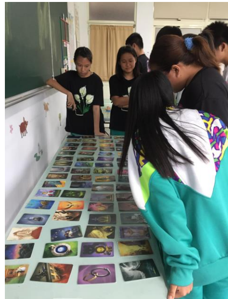
內容 3：透過「妙語說書人」圖片學習 表達與溝通