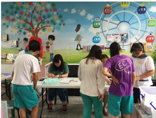
內容 4：輔導股長協助班級募款活動