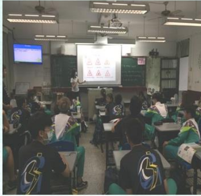
英文科— 繪製交通標誌英文圖標