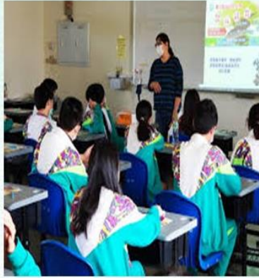
國文科— 在地文化踏查