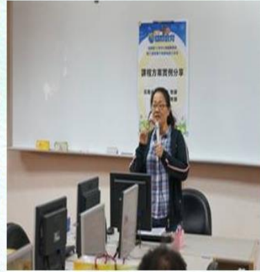
國際教育— 從公民素養看各國交通 禮儀